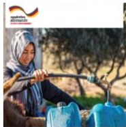
« Le renforcement de la participation des femmes dans la gestion intégrée des ressources en eau » Document d'orientation

Le renforcement de la participation des femmes dans la gestion intégrée des ressources en eau ;